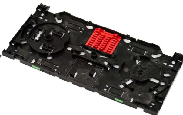
Kaseta w wersji dla 12 spawów fuzyjnych