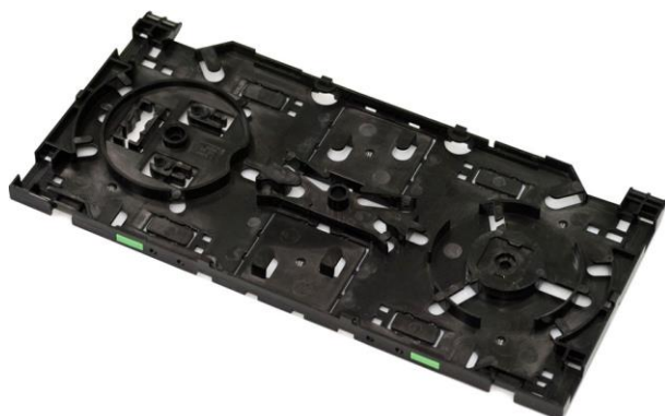
Kaseta z możliwością montażu spliterów