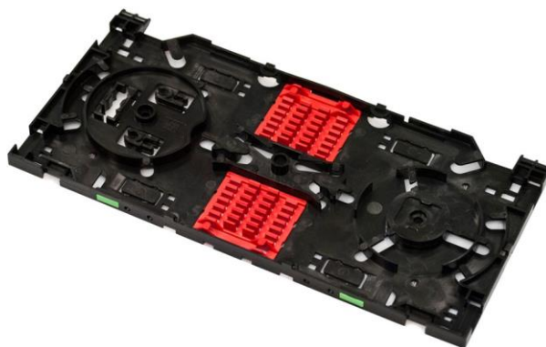
Kaseta w wersji dla 24 spawów fuzyjnych