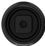
- wkładka kwadratowa