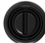
-wkładka z nacięciem